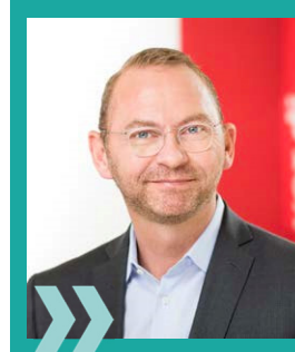
Frank Werneke ver.di-Vorsitzender

2020 wird die Bundestarifkommission für den öffentlichen Dienst in einem schriftlichen Verfahren über das Verhandlungsergebnis abstimmen.